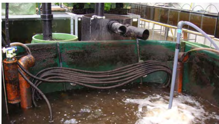
Abbildung 3: Heizschleife im Fischbecken 1

Im Fischbecken ist auf einer Wandseite eine Heizschleife installiert, bestehend aus 25 m Vegetationsheizung (GVZ Bolltec), aufgerollt auf 4 Kunststoffschienen und fixiert mit Kabelbindern. Die Wassertemperatur wird mit einem Messfühler erfasst (TK 113), auf einem Temperaturregler angezeigt (TR 524 93) und ein Magnetventil gesteuert (Siemens MVE22.20/180, alles Jost Renggli AG, Wolhusen), das den Warmwasserzufluss reguliert. Dieser Heizkreislauf ist angeschlossen an die Gewächshausheizung der HSW. Die gemessene Heizleistung beträgt 7 kW bei einer Vorlauftemperatur von 58 °C und einer Wassertemperatur von 28 °C.