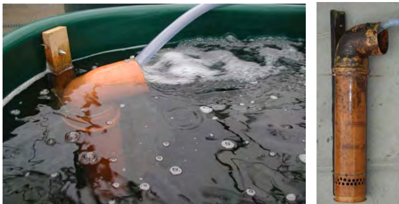
Abbildung 2: Luftheber zum Sauerstoffeintrag und Wasserzirkulation

Ziel der Belüftung ist ein Sauerstoffeintrag, um die Sauerstoffsättigung im System zu erhöhen. Zusätzlich wird im Rieselfilter auf natürliche Weise Sauerstoff eingetragen. Die Belüftung dient auch in extensiv betriebenen Anlagen als Sicherheitssystem, um bei Störungen im Wasserkreislauf den Fischen genügend Sauerstoff zur Verfügung zu stellen.