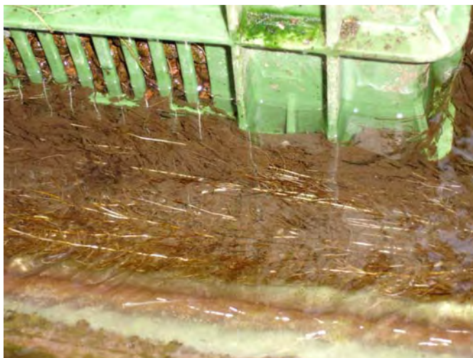
Abbildung 4: Filterrinnen in der Hydroponic (links) und Wurzelwerk von Tomaten (rechts)